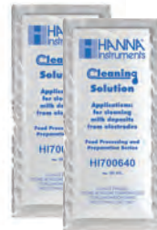
Solución de limpieza en sachet HI700640 para depósitos de lácteos (2)