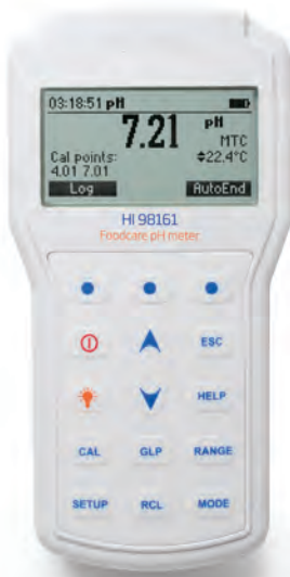
HI98161 Medidor de pH para alimentos incluye: