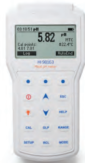
HI98163 Medidor de pH para carne incluye: