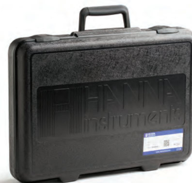
Maleta de transporte rígida

HI98164 Medidor de pH para Yogurt incluye: