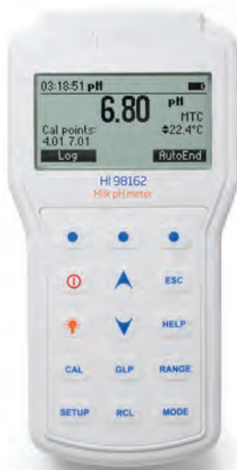
HI98162 Medidor de pH para leche incluye: