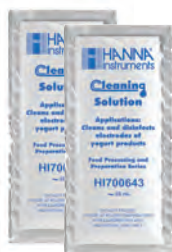
Solución de limpieza y desinfección en sachet HI700643 para productos de yogurt (2)