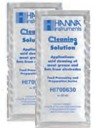
Solución de limpieza en sachet HI700630 para depósitos de carne y grasa (2)