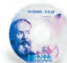
Software para PC HI92000