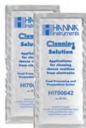
Solución de limpieza en sachet HI700642 para productos de queso (2)